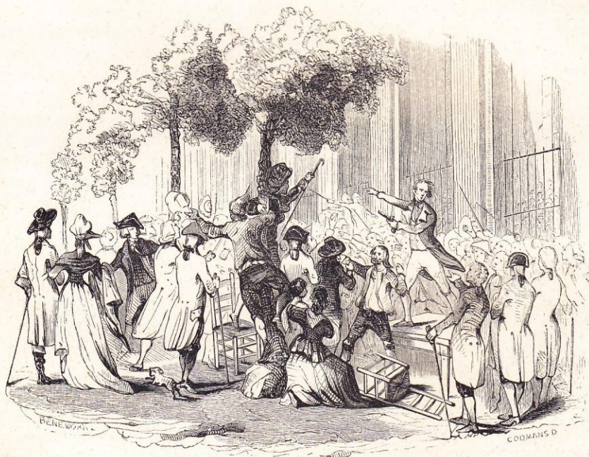
Camille-Desmoulins au Palais-Royal.

L'une est aussi entre pages 12 et 13 (éd. belge) de Histoire de la Révolution française de THIERS.